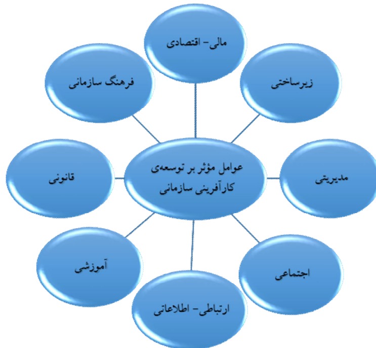
شکل ۲- عوامل مؤثر بر توسعه کارآفرینی سازمانی در تعاونی‌ها.

با توجه به مطالب یاد شده و جمع‌بندی انجام شده، اگر چه همه موارد یاد شده، بر شیوه تعاونی اشاره نداشتند، ولی با عنایت به ماهیت خودجوشی، خودیاری، انتخابی و دموکراتیک بودن مدیریت و داوطلبانه بودن تعاونی‌ها از یک سو و پایین بودن نسبی توانایی مالی اعضا، پایین بودن مهارت کارآفرینی اعضا و مدیریت، عدم توانایی بهره‌مندی از نهادها و منابع قدرت آن‌ها در مقایسه با بخش‌های دولتی و خصوصی، وجود عناصر و مؤلفه‌های سازنده و تسهیل‌گر عوامل یادشده، می‌تواند در توسعه کارآفرینی سازمانی تعاونی‌ها مؤثر باشد. شکل (۲) چارچوب مفهومی عوامل مؤثر بر توسعه کارآفرینی سازمانی در تعاونی‌ها را بر اساس جمع‌بندی و مرور مطالب، نشان می‌دهد.