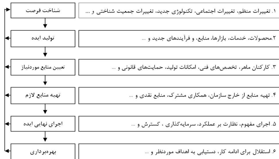
شکل ۳- مدل شش مرحله‌ای کارآفرینی سازمانی Morris and Kuratko (۲۰۰۲).